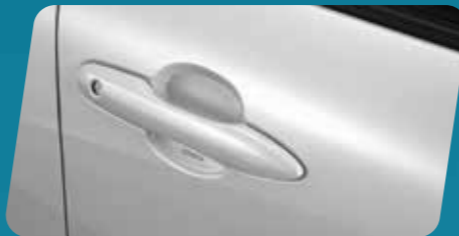
ỐP HỘM TAY VÂN CARBON (MÀU BẠC)