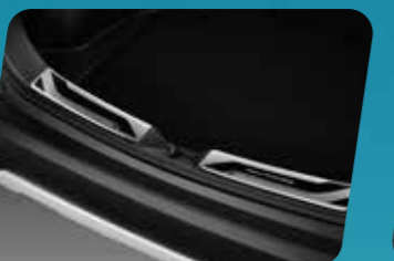
ỐP CHỐNG TRẦY CỘP SAU