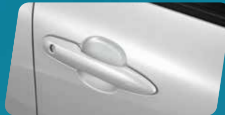
PHIM DÁN BẢO VỆ HỘM TAY NẮM CỬA