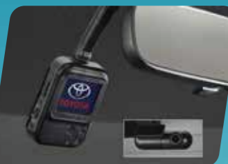
CAMERA HÀNH TRÌNH (GEN2)