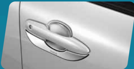
ỐP HỘM TAY NẮM CỬA (MÀ CRÔM)