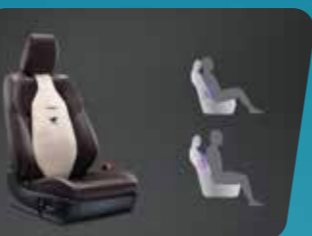
TỤA LƯNG GHẾ