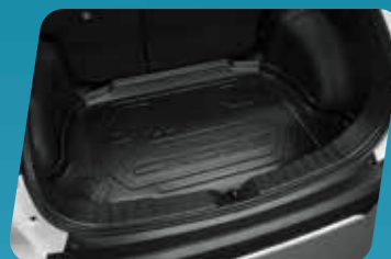
KHAY HÀNH LÝ