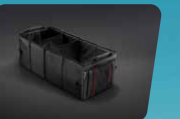
KHAY HÀNH LÝ GẤP GỌN