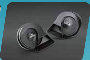
CÒI XE CAO CẤP