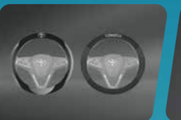
BỌC VÔ LĂNG