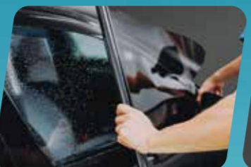
PHIM DÁN KÍNH