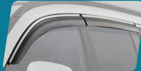
VỀ CHE MƯA (MÀ CRÔM)