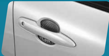
ỐP HỘM TAY VÂN CARBON (CAO SU)