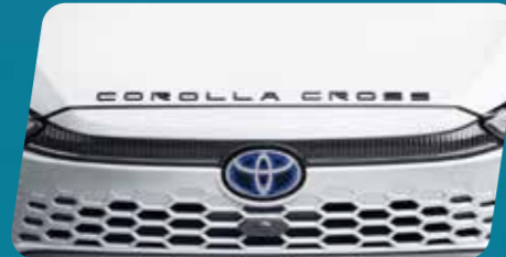
BIỂU TƯỢNG CHỮ COROLLA CROSS