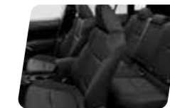
NỘI THẤT ĐEN