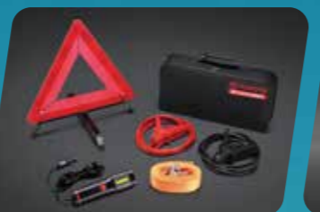
BỘ HỖ TRỢ KHẨN CẤP