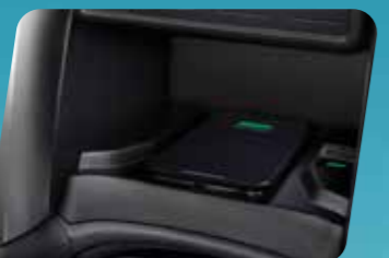
SẠC KHÔNG DÂY