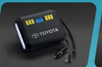
BƠM LỐP ĐIỆN TỬ