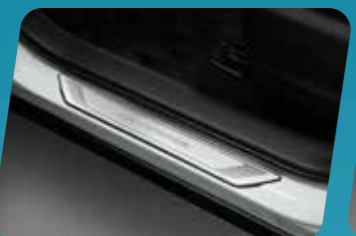
ỐP BẠC LÊN XUỐNG 4 CỬA