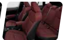
NỘI THẤT ĐỎ ĐẬM