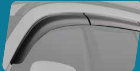
VỀ CHE MƯA